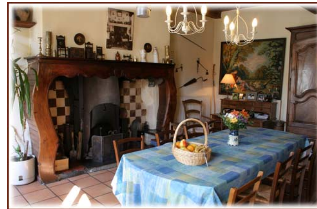
La salle à manger