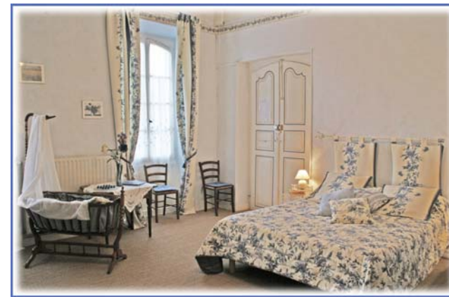
La chambre bleue