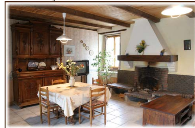
Gîte de l'Estaque