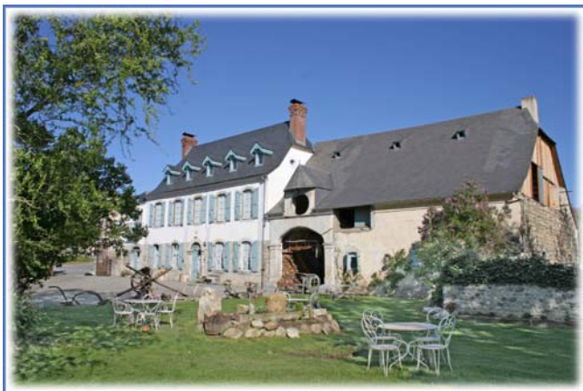
La maison Burret