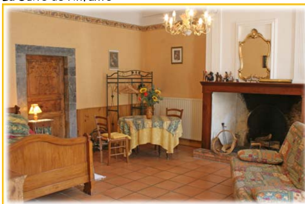
La chambre jaune

Quatre chambres et deux gîtes de caractère, vastes, lumineux, vous offrent leur confort et ce charme propre aux maisons d'autrefois.